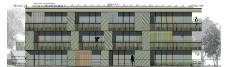
Haus 5 Ansicht Nord